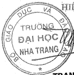
TRANG SĨ TRUNG

Bản thỏa thuận được làm thành 4 bản, mỗi bên giữ 2 bản có giá trị ngang nhau.