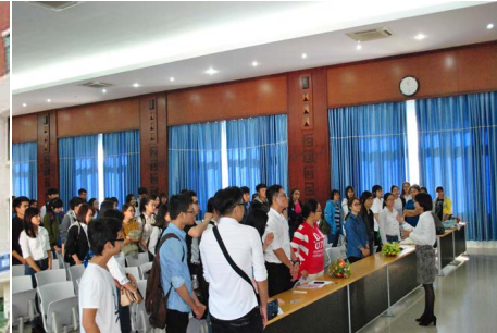
Sự kiện 8