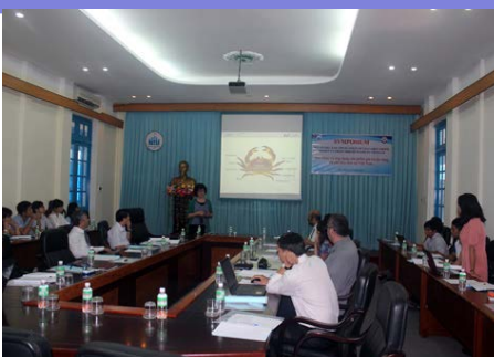
Nghiên cứu Khoa học 6-7